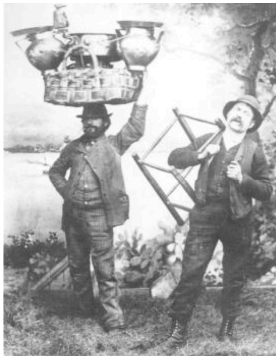
Vendeurs de limaçons

Contrairement à ce que dit L. Joffrin en ouverture de son livre sur Mai 68 (Joffrin 1988 : 5), ce n'est pas Mai 68 qui a changé la France, mais la France qui a changé le Mai 68 français . L'exception théorique française (de 1968 à aujourd'hui) est elle-même le produit de cette autre exception hexagonale qu'est la solution de continuité que les « événements » de mai-juin 1968 ont introduit dans la continuité du cour international des luttes des années soixante et soixante-dix (caractérisé comme on le sait par des pratiques telles que le débordement des